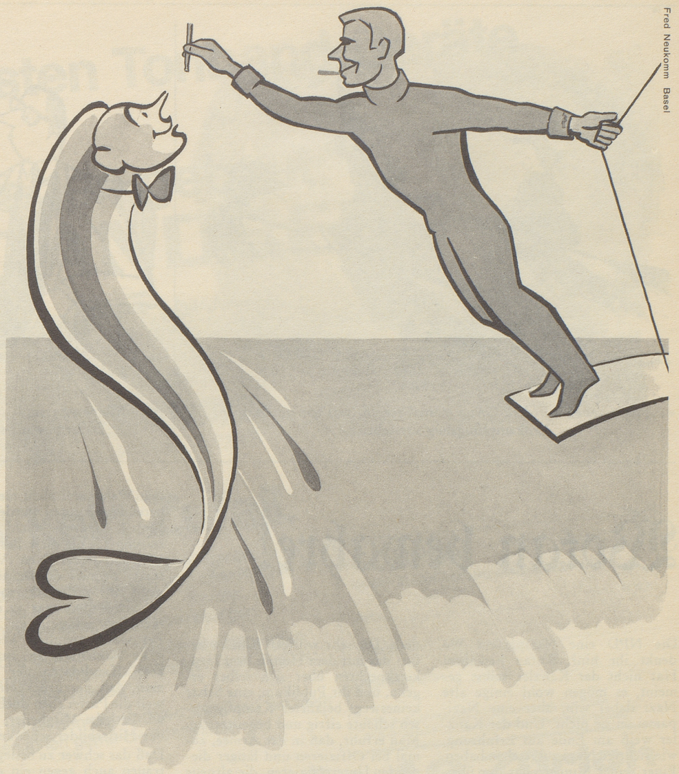
Fried Neukomm Basel

Die begehrte Mundstück-Zigarre der Zigarrenfabrik Hediger Söhne A.G. 5734 Reinach im Aargau.