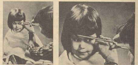
Welcher Ausschnitt ist wirkungsvoller? Sie sollen das Foto aussuchen, das besser gestaltet ist.

Die Lehrmethoden der Famous Photographers School sind so erfolgreich, dass viele unserer Absolventen jetzt ein stattliches Einkommen haben. Gute Fotografen sind überall in der Welt gesucht und werden gut bezahlt.