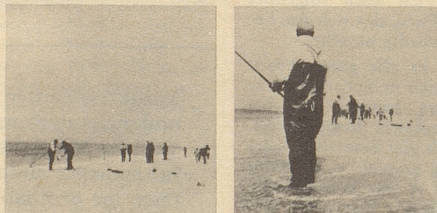
Welches ist das bessere Foto? Sie werden gefragt, welches Foto aussagekräftiger ist.

Sie arbeiteten drei Jahre an dem Fotokurs, in den sie alle Kenntnisse packten, die sie sich in jahrelanger Berufspraxis angeeignet hatten. Sie machten über 5000 «Lehrfotografien», damit alle Lektionen besonders anschaulich wurden. Dann entwickelten sie noch eine Reihe praktischer Aufgaben, die Sie mit Ihrer eigenen Kamera ausführen — bei sich zuhause oder in der Nachbarschaft, nach Ihrem eigenen Stundenplan.