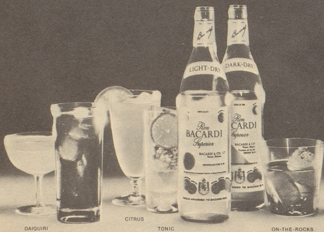
DAIQUIRI COLA CITRUS TONIC ON-THE-ROCKS