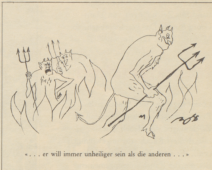
«... er will immer unheiliger sein als die anderen ...»

Nein – diese Haltung findet man sicher nicht in der Schweiz so extrem wie nicht gerade anderswo. Das mag in England anders sein, nicht aber in Westdeutschland. Und dennoch «erlauben» sich westdeutsche Fernsehstationen – besonders im Bereich der Politik und Kulturkritik – Sendungen, deren Angriffigkeit uns Schweizer verblüffen muß. Nicht, daß dabei einfach um der Angriffigkeit willen Polemik gemacht würde, sondern man geht einer Sache mit jener kühlen Objektivität auf den Leib (und auf die Person), die allein zur umfassenden Information führt. Ob man nun dem greisen Baldur von Schirach im offenen Gespräch auf den Zahn fühlt (über die Motive zu seiner Tätigkeit unter Hitler) oder ob man den Ausspruch des Bundeskanzlers, die Armee sei die Schule der Nation, von allen Seiten (auch von Kiesinger selbst) beleuchten läßt, ob man die Parteiprogramme kritisch unter die Lupe nimmt oder (oft geradezu selbstpeinigend) die Vergangenheit zu bewältigen sucht – hier fordert oft das Deutsche Fernsehen (I und II) unsere Bewunderung heraus und die Frage: Hätte man bei uns auch den Mut, in solcher Art «angriffslustig» zu sein. Oder sind wir auch in dieser Beziehung ein «Sonderfall»? Tele-Spalter