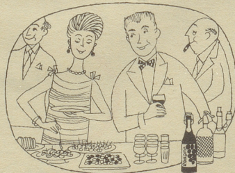
Am Party-Buffer darf er nicht fehlen, der beliebte gehaltvolle Traubensaft

war die Halskrause, welche die ehrwürdigen Herren von Zürich im Mittelalter bei jeder Temperatur um den Hals geschlungen trugen. Und wir reklamieren schon wegen der Krawatte! Wir nehmen es kühl. Wenn es draußen zu heiß wird, schauen wir uns prächtige Orientteppiche bei Vidal an der Bahnhofstraße 31 in Zürich an und denken daran, daß es an anderen Orten noch viel heißer ist!