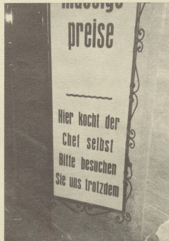
Aufgenommen in Alassio von H. Müller, Luzern