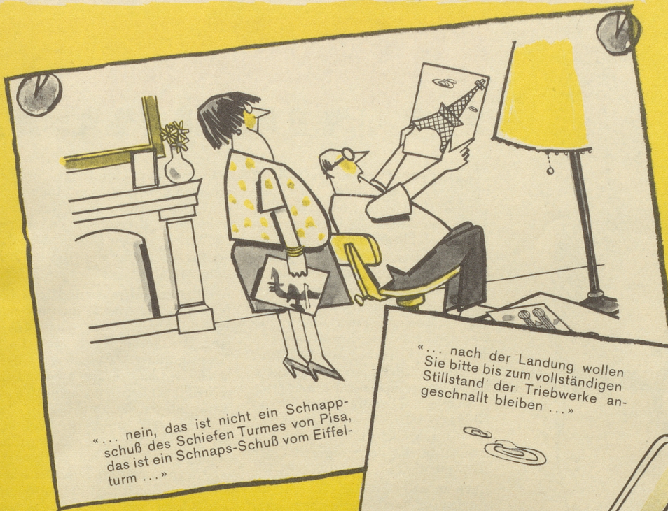
«... nein, das ist nicht ein Schnappschuß des Schiefen Turmes von Pisa, das ist ein Schnaps-Schuß vom Eiffelturm ...»