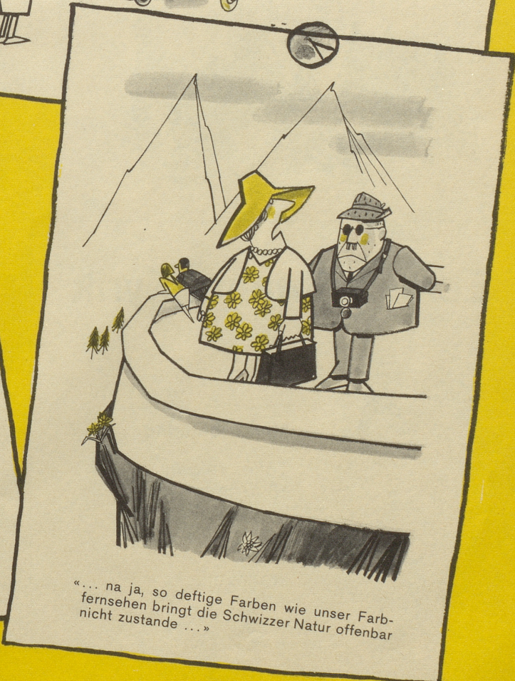
«... na ja, so deftige Farben wie unser Farbfernsehen bringt die Schwizzer Natur offenbar nicht zustande ...»