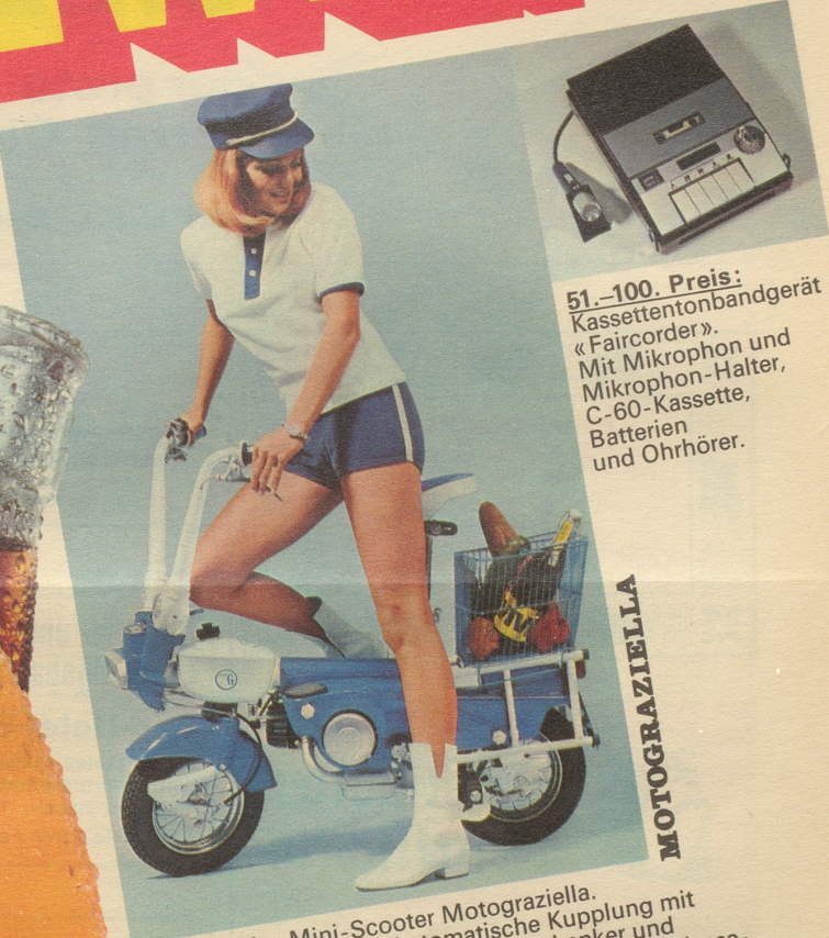
51.-100. Preis: Kassettentonbandgerät «Faircorder». Mit Mikrofon und Mikrofon-Halter, C-60-Kassette, Batterien und Ohrhörer.