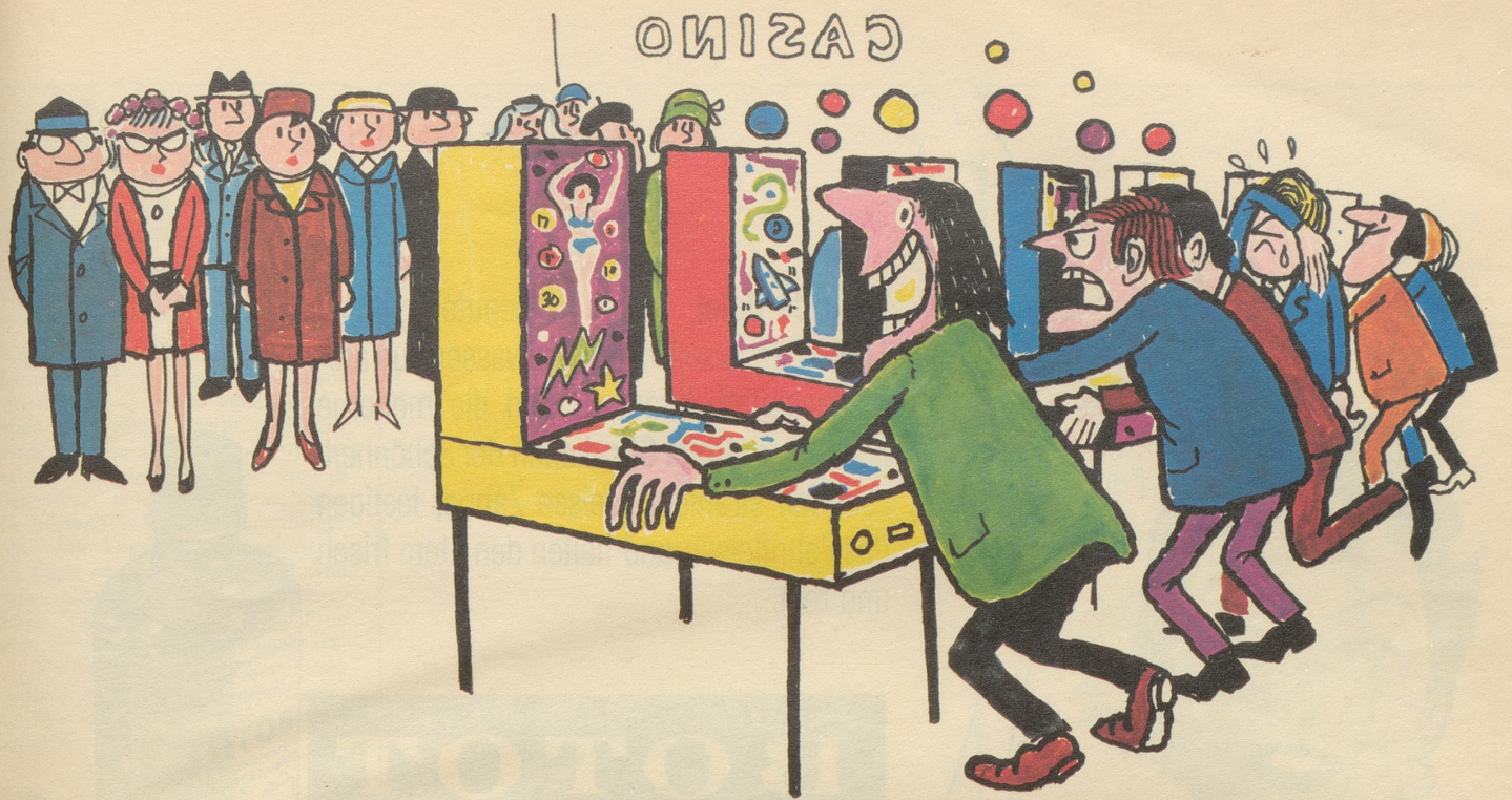
Las Vegas, Monte Carlo, Divonne – was sind sie gegen Zürich? Erschüttert verfolgen die Teilnehmer die Leidenschaftsausbrüche der Spieler!