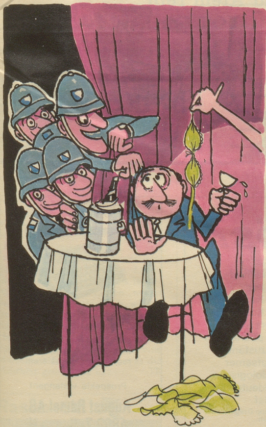
Besuch eines Dancings. Die Attraktionen sind raffiniert synchronisiert mit den Uhren der Zürich-bei-Nacht-Wächter, mit dem letzten Schleier der Tänzerin fällt zugleich der Schleier der Nacht.