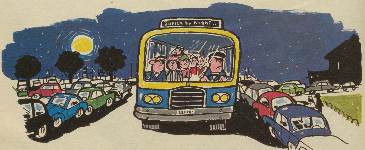
Dann eine erregende Rundfahrt durch die nächtlichen Straßen, mit Aussicht auf das Miliö.