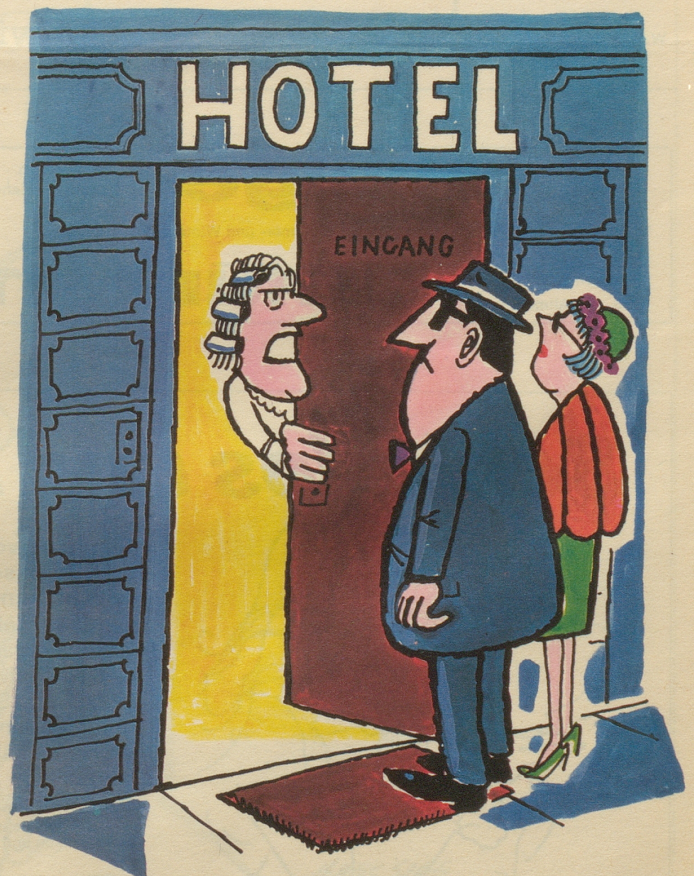
Letzter Programmpunkt: Um Mitternacht werden die Gäste in ihr Hotel zurückgebracht. «Natürlich schließe ich um zehn Uhr! Ich führe ein anständiges Hotel, und wenn ich gewußt hätte, daß Sie die ganze Nacht durchzechten und Orgien feiern, hätte ich Sie niemals aufgenommen!»

Den Clou des Zürcher Nachtlebens schildert Hans Moser in der nächsten Nebenummer!