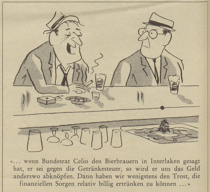
«... wenn Bundesrat Celio den Bierbauern in Interlaken gesagt hat, er sei gegen die Getränkesteuer, so wird er uns das Geld anderswo abknöpfen. Dann haben wir wenigstens den Trost, die finanziellen Sorgen relativ billig ertränken zu können ...»