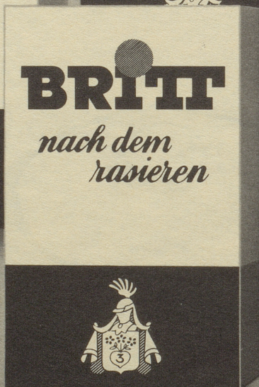
BRITT nach dem Rasieren

Verhindert nach dem Rasieren, ob elektrisch oder mit Seife und Klinge, Reizungen, Rötungen und hält die Haut elastisch und jung.