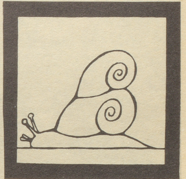
Wohlhabende Schnecke mit Zweifthus