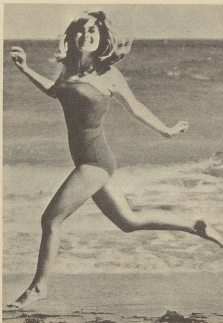
Welches Foto trifft die Idee am besten? Entscheiden Sie, welches dieser Bilder den Sinn des Wortes «Geschwindigkeit» besser wiedergibt!