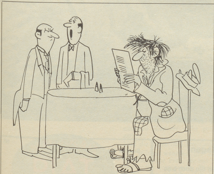
«... er sagt, er habe sich heute der Bedienung entsprechend gekleidet, die ihm hier das letzte Mal zuteil wurde!»