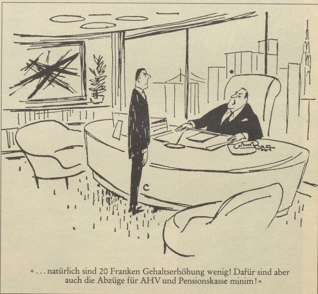
«... natürlich sind 20 Franken Gehaltserhöhung wenig! Dafür sind aber auch die Abzüge für AHV und Pensionskasse minim!»