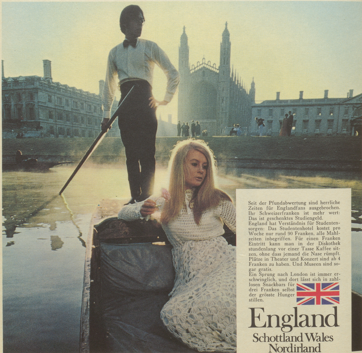
Der River Cam in Cambridge

So lernt man am besten Englisch: Zum Englischkurs in Cambridge gehören: Ein College, rund um dieses College 3 Diskotheken mit Beat- und Soul-Music, 6 extravagante Boutiques, 2 faszinierende Museen und eine Menge interessante Leute.