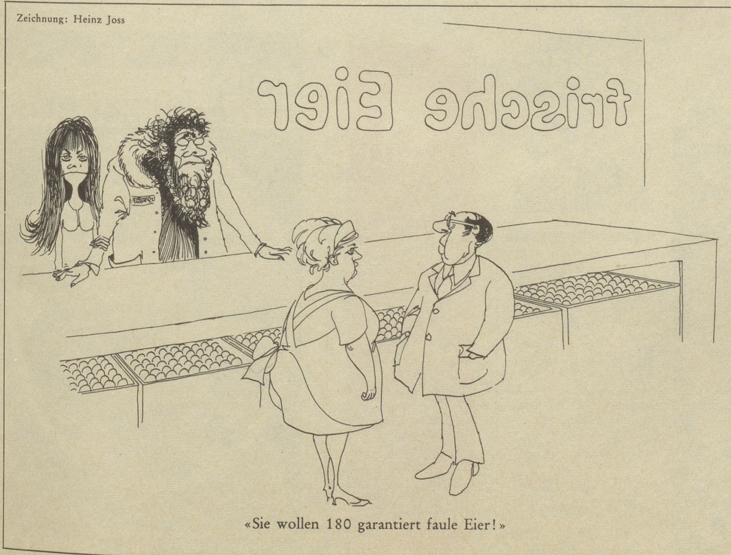
Zeichnung: Heinz Joss

«Ach», seufzt die Dame, «ich bin einfach des jahrelangen Alleinseins müde!» tr