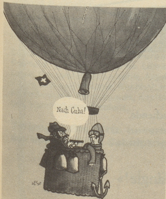
Jüsp in Nebelspalter, Switzerland