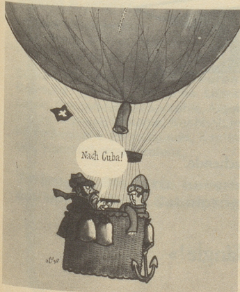
Jüsp in Nebelspalter, Switzerland