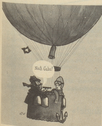
Jüsp in Nebelspalter, Switzerland