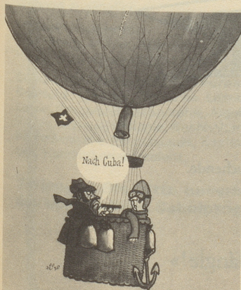
Jüsp in Nebelspalter, Switzerland