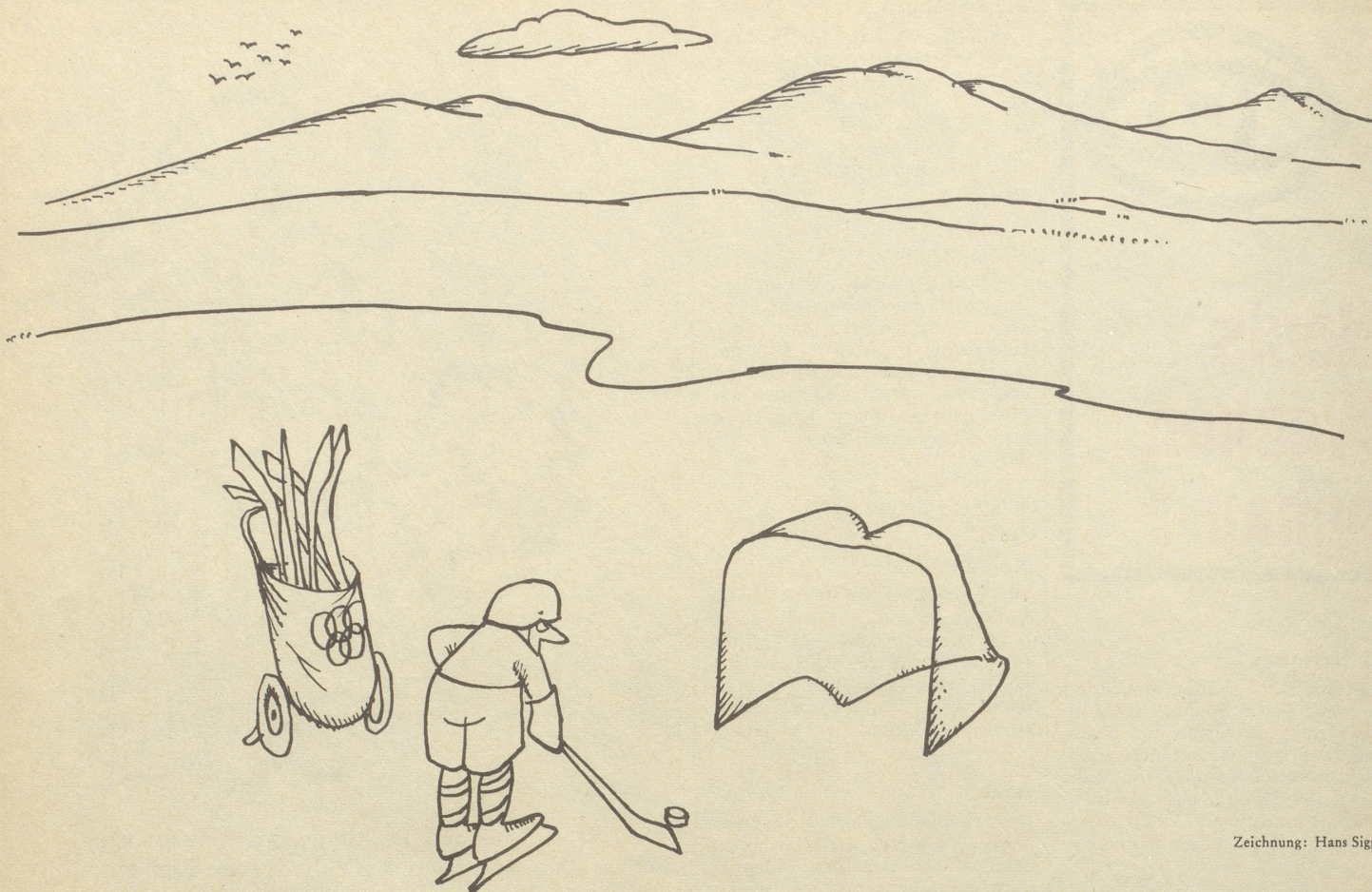
Zeichnung: Hans Sigg