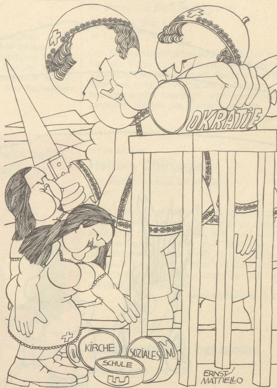
Die Scheiben, die von der schweizerischen Demokratiewurst für die Frauen abfallen.

Zwiesgespräch zweier Delegierter: «Das Massaker muß endlich aufhören!» «Da haben Sie ganz recht, wegen Biafra sollte nun etwas Endgültiges geschehen.» «Was heißt Biafra? In Suez ist ein General an der Front gefallen!»