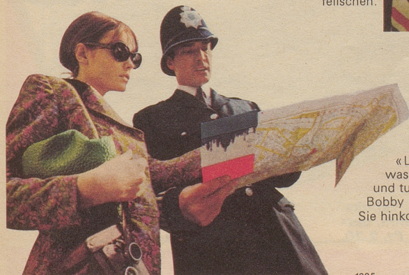
Der Bobby – Ihr Freund und Helfer. Eine unentbehrliche Institution, wenn Sie nicht mehr weiter wissen. Verlangen Sie die British Travel Broschüre «London»: Sie zeigt Ihnen, was Sie alles sehen und tun können. Der Londoner Bobby zeigt Ihnen, wie Sie hinkommen.