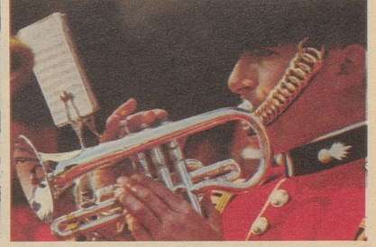
Die berühmte Band der Grenadier Guards auf dem Marsch über die Mall.