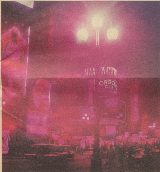
Glanz-Lichter: Der Piccadilly Circus ist der Mittelpunkt Londons. Von hier führen alle Wege ins Vergnügen: Zu den Theatern – zu den Nachtclubs in Soho – zur nahen Bond Street, dem exklusiven Einkaufszentrum.

Portobello Road: Der aufregendste, ungewöhnlichste aller Londoner Märkte. Occasionen zu Aberdutzenden. Antiquitäten zu Hunderten. Preise für jedes Budget. Und wenn Ihnen Antiquitäten nicht zusagen: Hören Sie zu, wie Käufer und Händler miteinander feilschen.