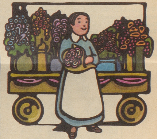
Märkte im Freien: London ist gesteckt voll von Märkten. Sehr günstig einkaufen können Sie in der Petticoat Lane. Antike Möbel in Massen finden Sie in Bermondsey.

Der Bobby – Ihr Freund und Helfer. Eine unentbehrliche Institution, wenn Sie nicht mehr weiter wissen. Verlangen Sie die British Travel Broschüre «London»: Sie zeigt Ihnen, was Sie alles sehen und tun können. Der Londoner Bobby zeigt Ihnen, wie Sie hinkommen.