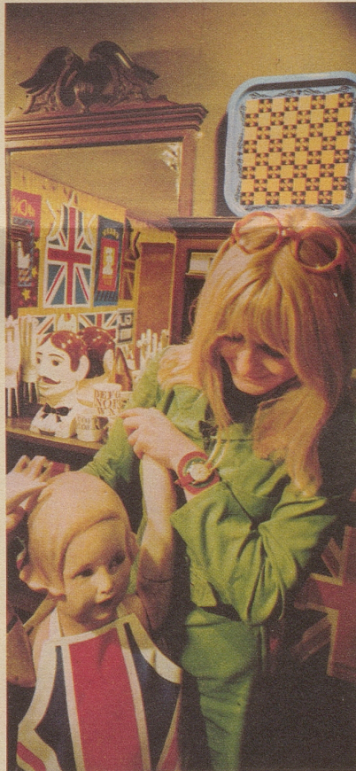
Portobello Road: Der aufregendste, ungewöhnlichste aller Londoner Märkte. Occasionen zu Aberdutzenden. Antiquitäten zu Hunderten. Preise für jedes Budget. Und wenn Ihnen Antiquitäten nicht zusagen: Hören Sie zu, wie Käufer und Händler miteinander feilschen.