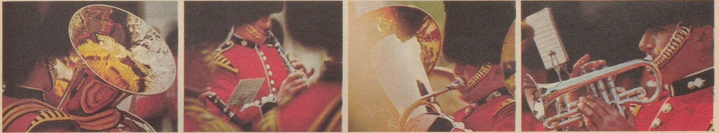
Die berühmte Band der Grenadier Guards auf dem Marsch über die Mall.

London ehrt seine berühmten Männer mit Gedenktafeln an den Häusern, in denen sie lebten. Erstaunlich, wie viele man schon auf einem kurzen Bummel entdeckt.