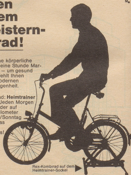
Rex-Kombirad auf dem Heimtrainer-Sockel

Verlangen Sie Prospekt und Preisliste mit den günstigen Teilzahlungs- bedingungen: REX-VERTRIEB AG, 4500 Solothurn.