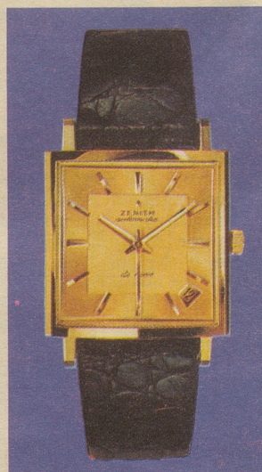
Ref. 10.610 Gold 18 Kt., automatisch wasserdicht, Kalender, Luxus- Zifferblatt Fr. 980.— gleiches Modell, Edelstahl oder Plaqué Fr. 285.—

Ref. 20.620 Gold 18 Kt., automatisch, wasserdicht Kalender, Goldband Fr. 2200.— gleiches Modell, mit Lederband Fr. 1100.— gleiches Modell, Edelstahl Fr. 280.—