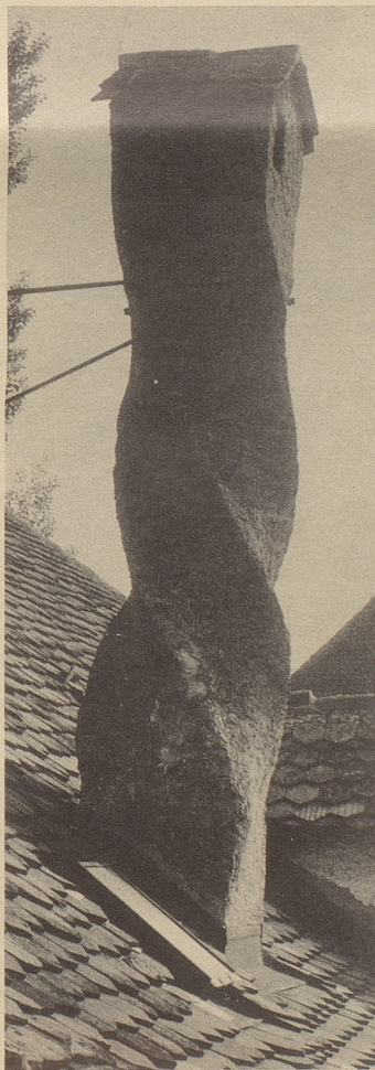
Was hat wohl dem Kaminbauer in Murten so den Kopf verdreht?