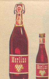
Merlino Traubensaft auch in der Liter- und der 2-dl-Flasche

Sie können und werden es sein, wenn Sie schon als Auftakt viel frohe Laune auf den Tisch stellen mit Merlino Grand Raisin und Merlino Clairet. Diese neuen Dreistern-Traubensäfte sind eine Zierde für jeden Tisch: der weisse, moussierende Grand Raisin ist Auftakt und Höhepunkt jedes Festes, und der fruchtig-rubinrote Clairet passt sehr gut zu den Mahlzeiten und den modernen Snacks. Sie dürfen damit grosszügig sein, denn die Flasche kostet nur Fr. 2.95 (mit Rabatt, Einwegflasche ohne Pfand). Erhältlich in Lebensmittelgeschäften, Reformhäusern, Drogerien und durch unsere Depots in der ganzen Schweiz.