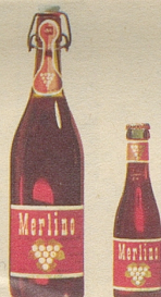
Merlino Traubensaft auch in der Liter- und der 2-dl-Flasche

Sie können und werden es sein, wenn Sie schon als Auftakt viel frohe Laune auf den Tisch stellen mit Merlino Grand Raisin und Merlino Clairret. Diese neuen Dreistern-Traubensäfte sind eine Zierde für jeden Tisch: der weisse, moussierende Grand Raisin ist Auftakt und Höhepunkt jedes Festes, und der fruchtig-rubinrote Clairret passt sehr gut zu den Mahlzeiten und den modernen Snacks. Sie dürfen damit grosszügig sein, denn die Flasche kostet nur Fr. 2.95 (mit Rabatt, Einwegflasche ohne Pfand). Erhältlich in Lebensmittelgeschäften, Reformhäusern, Drogerien und durch unsere Depositäre in der ganzen Schweiz.