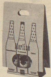
im 3er Multipack nur Fr. 7.85 statt Fr. 8.85

Sie können und werden es sein, wenn Sie schon als Auftakt viel frohe Laune auf den Tisch stellen mit Merlino Grand Raisin und Merlino Clairnet. Diese neuen Dreistern-Traubensäfte sind eine Zierde für jeden Tisch: der weisse, moussierende Grand Raisin ist Auftakt und Höhepunkt jedes Festes, und der fruchtig-rubinrote Clairnet passt sehr gut zu den Mahlzeiten und den modernen Snacks. Sie dürfen damit grosszügig sein, denn die Flasche kostet nur Fr. 2.95 (mit Rabatt, Einwegflasche ohne Pfand). Erhältlich in Lebensmittelgeschäften, Reformhäusern, Drogerien und durch unsere Depositäre in der ganzen Schweiz.