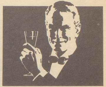
Ein 13er im Toto ...?

Ueber dieses Ereignis (auch ein 12er genügt) werden Sie sich bei einer Flasche HENKELL TROCKEN freuen!