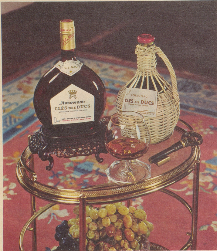
Armagnac CLES des DUCS, die Marke des Kenners Generalvertretung: Emil Benz Import AG, 8037 Zürich