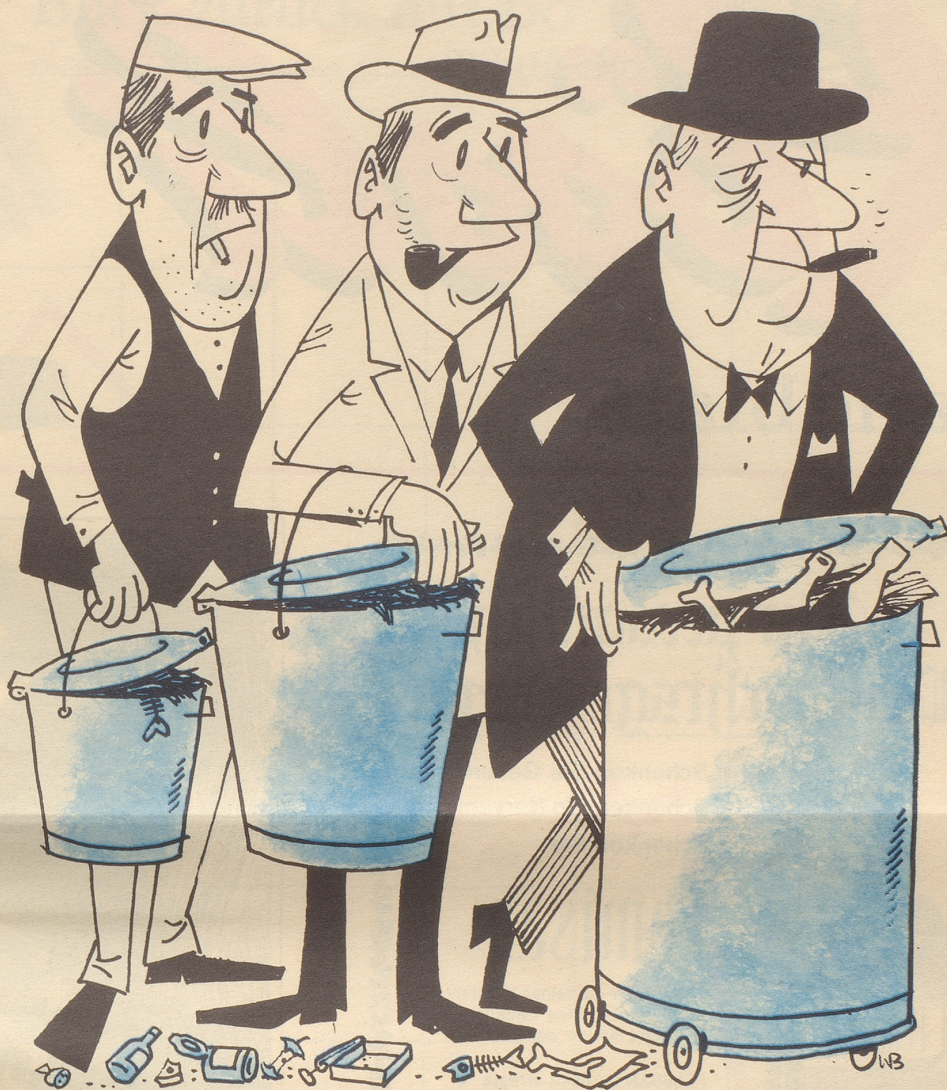
Der Müllanfall wächst

Keiner. Beide befassen sich fast ausschließlich mit der Frau. Hege