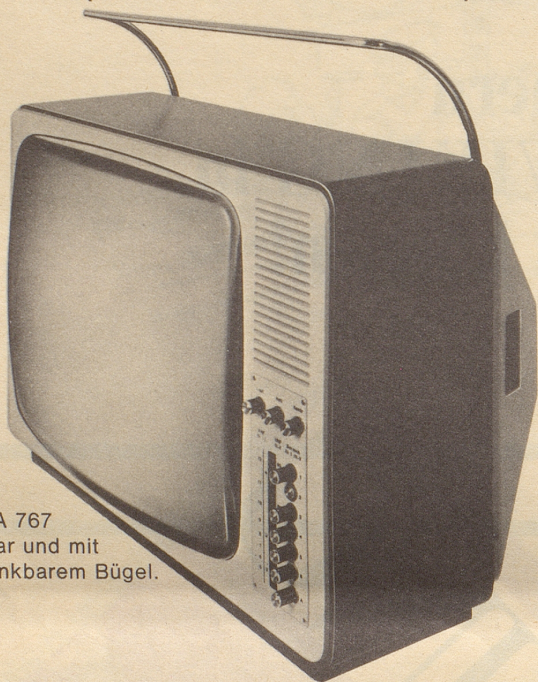
WEGA 767 tragbar und mit versenkbarem Bügel.

Sehen Sie: Dies ist der Fernseher für Fernseh- Individualisten (Lesen Sie warum...)