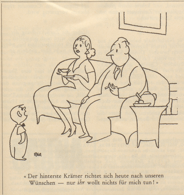
«Der hinterste Krämer richtet sich heute nach unseren Wünschen — nur ihr wollt nichts für mich tun!»