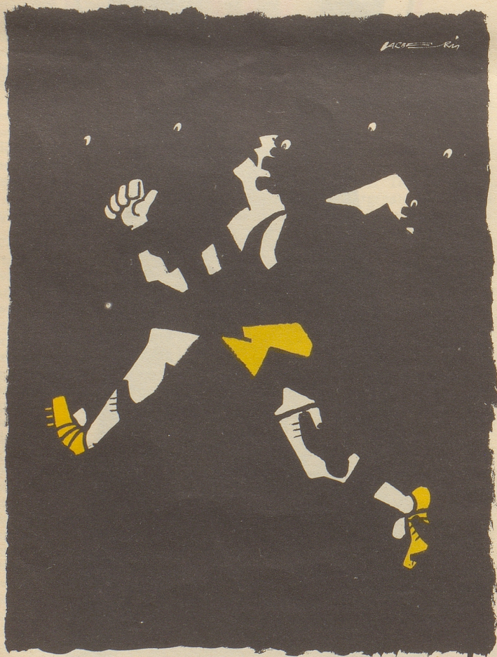
Was ist das?

Ein weißer Läufer zwischen Negern in irgendeinem Laufwettkampfbewerb an den Olympischen Spielen Mexico 68.