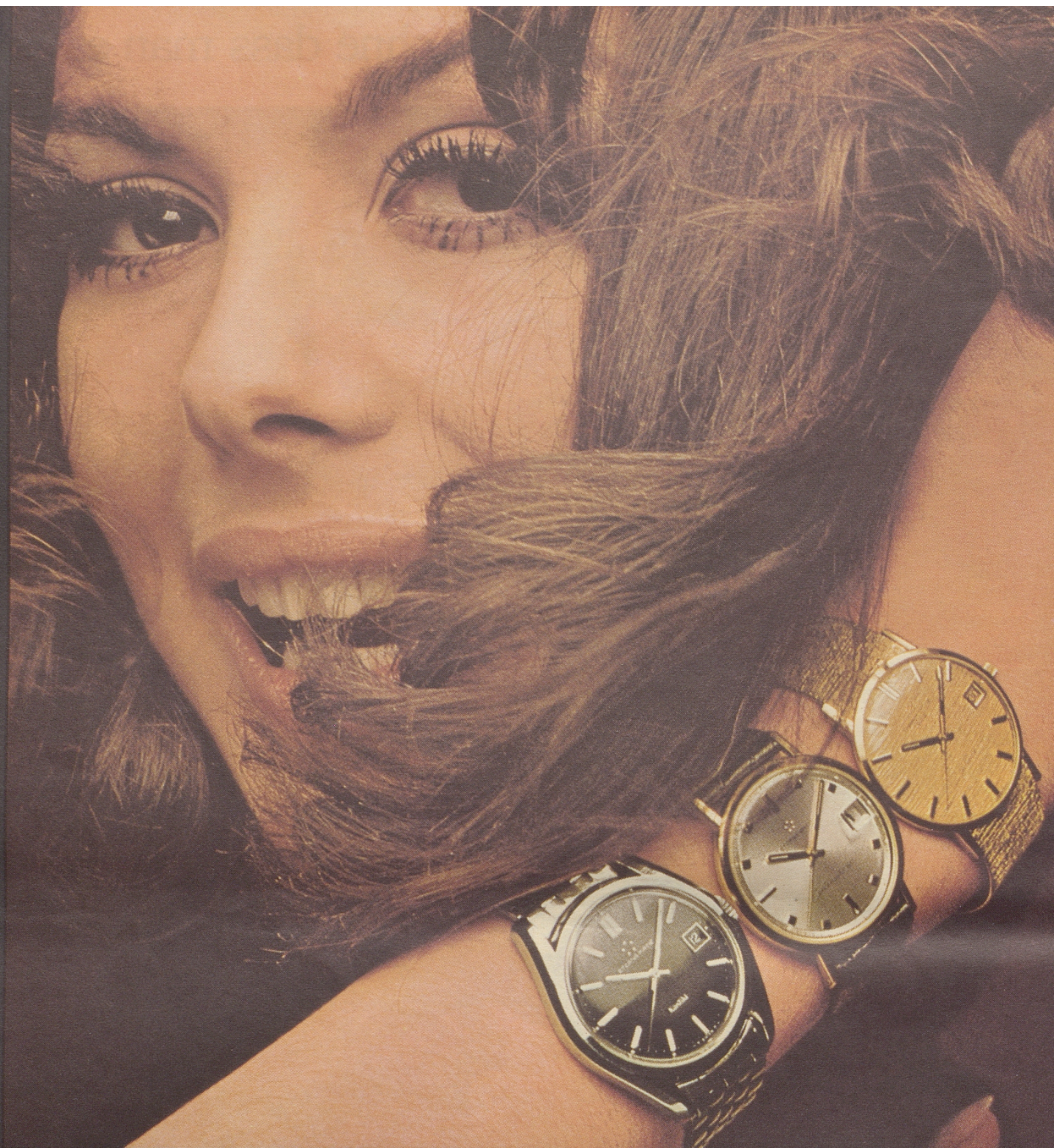
Eterna-Matic 1000 und KonTiki Eterna-Matic Centenaire Eterna-Matic 3000 und Sevenday