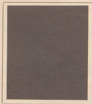
Diese Paßphoto habe ich selber geknipst, mit Selbstayslöser. Leider vergaß ich dabei, den Schutzdeckel von der Linse zu entfernen.