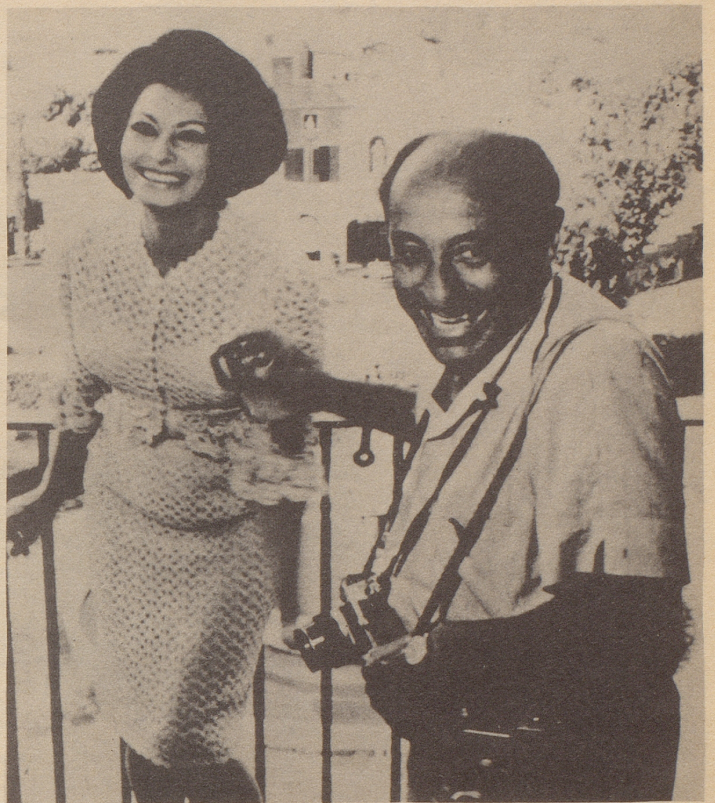
Alfred Eisenstaedt, ein weltberühmter Fotograf, wird dafür bezahlt, dass er die schönsten Frauen der Welt fotografiert (wie z. B. Sophia Loren). Er ist stets auf der Reise zu Orten, wo die meisten gerne ihre Ferien verbringen möchten – zur Südsee, zur Karibischen See, zu den Hauptstädten in aller Welt.

Sie an Ihren Fotografien besser machen können. Dann schreiben sie Ihnen einen ausführlichen, persönlichen Brief mit Ratschlägen und Anleitungen. Der Unterricht ist ebenso persönlich wie die Ausbildung, die ein vielversprechender Assistent von einem Meisterfotografen erhält.