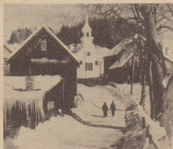
Ein einziges Foto kann Ihnen Jahr für Jahr Geld einbringen. Diese Aufnahme von Arthur d'Arazien hat ihm fast 36.000 Franken eingebracht. Und noch immer besitzt er das Urheberrecht.

Ihre Lehrer sind alle erfahrene Berufsfotografen, die unter der Führung der berühmten Fotografen arbeiten. Sie verwenden oft bis zu zwei Stunden auf eine Ihrer Arbeiten, die Sie der Schule einschicken. Durch Bilder und Diagramme zeigen sie Ihnen genau, was