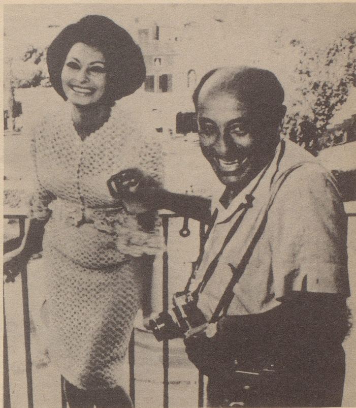
Alfred Eisenstaedt, ein weltberühmter Fotograf, wird dafür bezahlt, dass er die schönsten Frauen der Welt fotografiert (wie z. B. Sophia Loren). Er ist stets auf der Reise zu Orten, wo die meisten gerne ihre Ferien verbringen möchten – zur Südsee, zur Karibischen See, zu den Hauptstädten in aller Welt.

Sie an Ihren Fotografien besser machen können. Dann schreiben sie Ihnen einen ausführlichen, persönlichen Brief mit Ratschlägen und Anleitungen. Der Unterricht ist ebenso persönlich wie die Ausbildung, die ein vielversprechender Assistent von einem Meisterfotografen erhält.