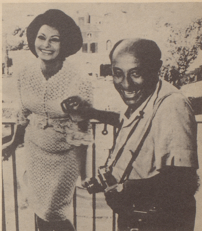
Alfred Eisenstaedt, ein weltberühmter Fotograf, wird dafür bezahlt, dass er die schönsten Frauen der Welt fotografiert (wie z. B. Sophia Loren). Er ist stets auf der Reise zu Orten, wo die meisten gerne ihre Ferien verbringen möchten – zur Südsee, zur Karibischen See, zu den Hauptstädten in aller Welt.

Sie an Ihren Fotografien besser machen können. Dann schreiben sie Ihnen einen ausführlichen, persönlichen Brief mit Ratschlägen und Anleitungen. Der Unterricht ist ebenso persönlich wie die Ausbildung, die ein vielversprechender Assistent von einem Meisterfotografen erhält.