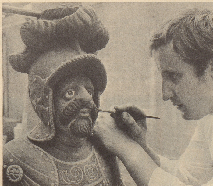
Make up — not war!