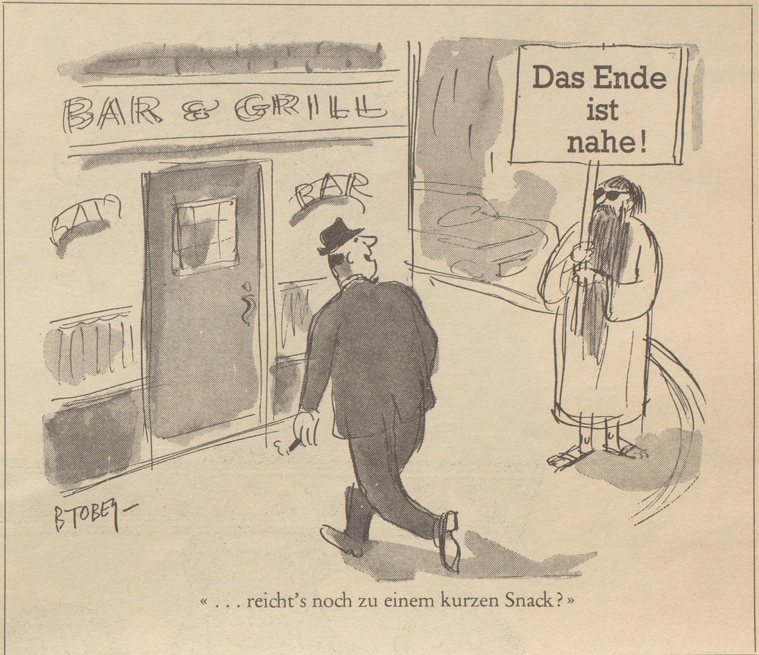
«... reicht's noch zu einem kurzen Snack?»