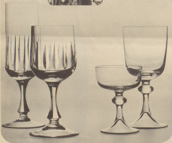
1039 RAGUSA, mit Polierschliff 1027 FREESIA, ohne Schliff

Zwiesel's Glasmacher- und Glasbläserkunst hat sich über Generationen vererbt und vervoll- kommt.