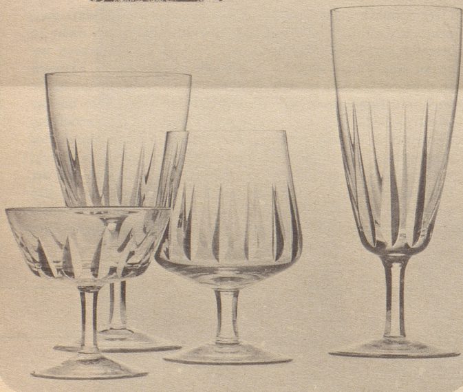
1037 MESSINA, Polierschliff

Seit Generationen versteht man sich in Zwiesel darauf, Kunstwerke aus Glas von Mund zu blasen — Schönes und Wertvolles preisgünstig herzustellen. Zum Beispiel die Tafelgläser MESSINA. Eine anmutige Form von vollendeter Brillanz.