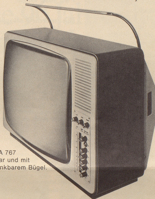
WEGA 767 tragbar und mit versenkbarem Bügel.

Sehen Sie: Dies ist der Fernseher für Fernseh- Individualisten (Lesen Sie warum...)