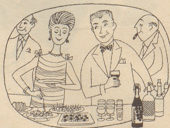
Am Party-Buffer darf er nicht fehlen, der beliebte gehaltvolle Traubensaft

Kaninchen sind sicher ebenso liebe Nerze, und ihre Pelze geben gleich warm. Und doch ist der Nerz begehrt, weil er exklusiver ist. Alle Teppiche decken den Boden, und doch sind Orientteppiche von Vidal an der Bahnhofstraße 31 in Zürich begehrt, weil sie feiner, und schöner sind, ein zusätzlicher Schmuck auch des elegantesten Heimes.