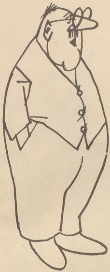
Vater Rindlisbacher, Krankenkassenkassier: «Wenn ich jeweils von meinem Jaßabend nach Hause kehre, brauche ich nur die Augen zu schließen, und sogleich sehe ich fliegende Leuchtkörper.»