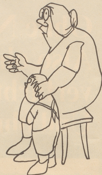
Großmutter Zraggen, Bäuerin: «Ich sah so etwas im Ziegerlimoos, genau an der Stelle wo früher das Schwarzmannli umging. Am Gasthof «zum Ochsen» steht ja auch geschrieben «Tellerservice.»»