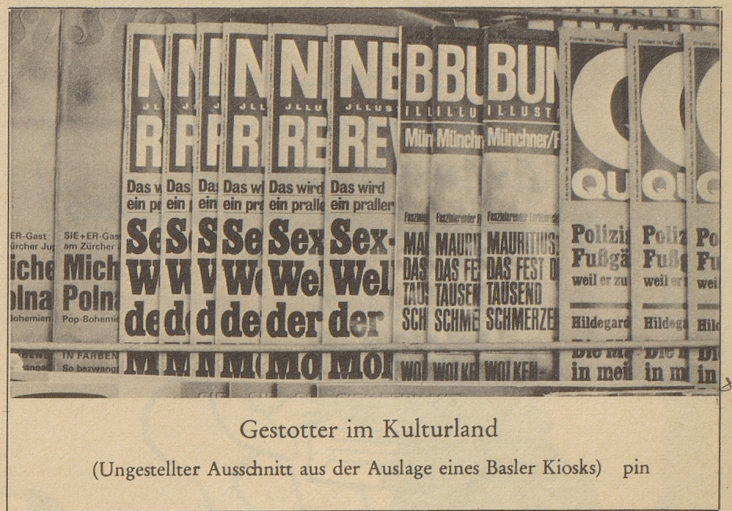
Gestotter im Kulturland

eitrige Geschwüre bekämpft auch bei veralteten Fällen die vorzügliche, in hohem Maße reiz- und schmerzlindernde Spezial-Heilsalbe Buthaesan. Machen Sie einen Versuch. Tuben zu 30 g; 50 g; Klistrikpack. 250 g. In Apoth. u. Drog. Buthaesan