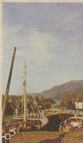
◀ Am Caledonian Canal in der Gegend des Loch Ness.

BEA oder Swissair für Ihre Ferien in England