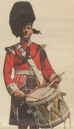
Trommler der berühmten Highland Light Infantry im traditionellen Kilt.