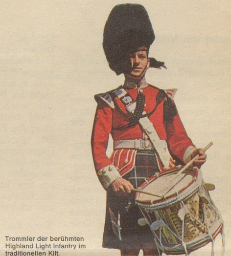
Trommler der berühmten Highland Light Infantry im traditionellen Kilt.