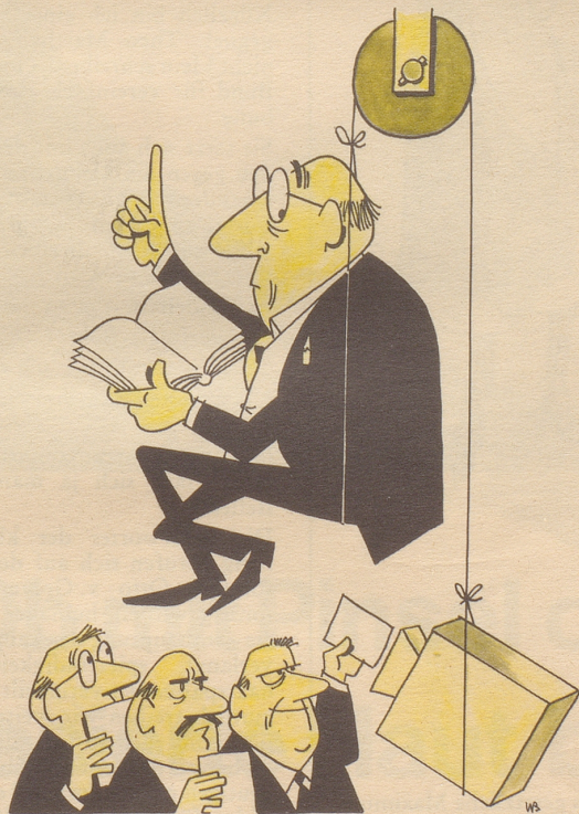
Zu lange hängt er schon am Faden Als sei's ein Knecht von Bürgers Gnaden.