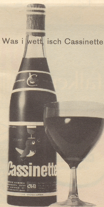
Was i wett isch Cassinette

Zuschriften für die Frauenseite sind an folgende Adresse zu senden: Redaktion der Frauenseite, Nebelspalter, 9400 Rorschach. Nichtverwendbare Manuskripte werden nur zurückgesandt, wenn ihnen ein frankiertes und adressiertes Retourcouvert beigelegt ist. Manuskripte sollen 1 1/2 Seiten Maschinenschrift mit Normalschaltung nicht übersteigen, und dürfen nur einseitig beschrieben sein. Bitte um volle Adreßangabe auf der Rückseite des Manuskripts.