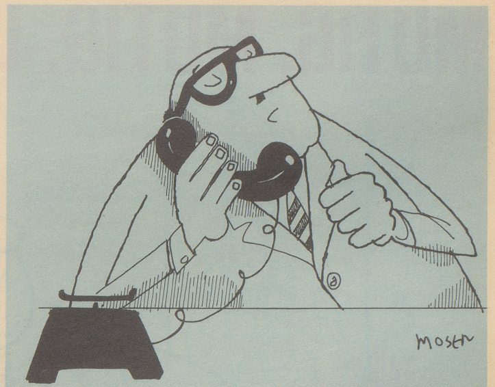
7. und für Politiker. (Bester Seelentröst für sie ist das Abspielen der Tonbänder mit ihren gesammelten Reden)